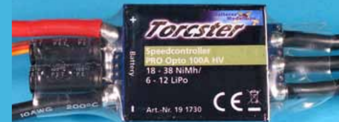
Der eingesetzte Drehzahlsteller Torcster Speedcontroller Pro Opto 100 A HV ist baugleich mit dem XQ 100 im Vertrieb von Pichler