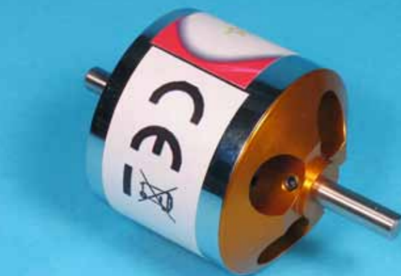
Kühlöffnungen der Glocke