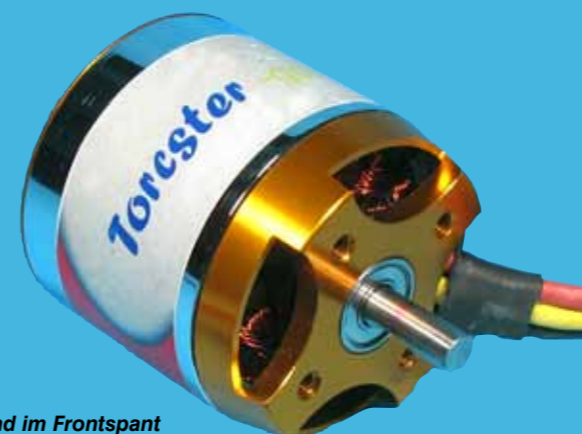
... und im Frontspant