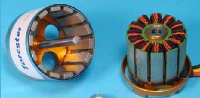
Glocke und Stator